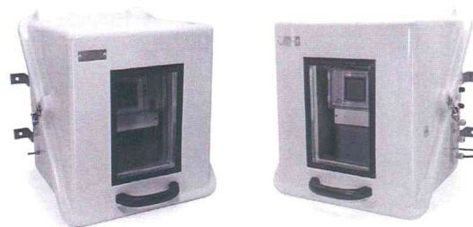
Рисунок 1 – Внешний вид термостата ТС-1